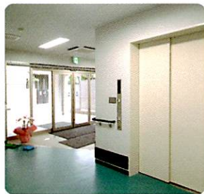
入り口・エレベーター